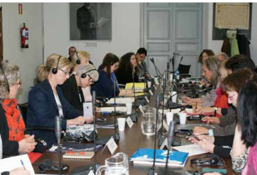
La FEMP fue el escenario de varias reuniones de seguimiento del proyecto.

No obstante, Liss Shanke considera que lo importante para la gente que trabaja dentro de los municipios, lo esencial, es cómo se pueden dar los mejores servicios para los habitantes. "Y este reto es común para todos los municipios, aunque las soluciones puedan o no ser diferentes" .